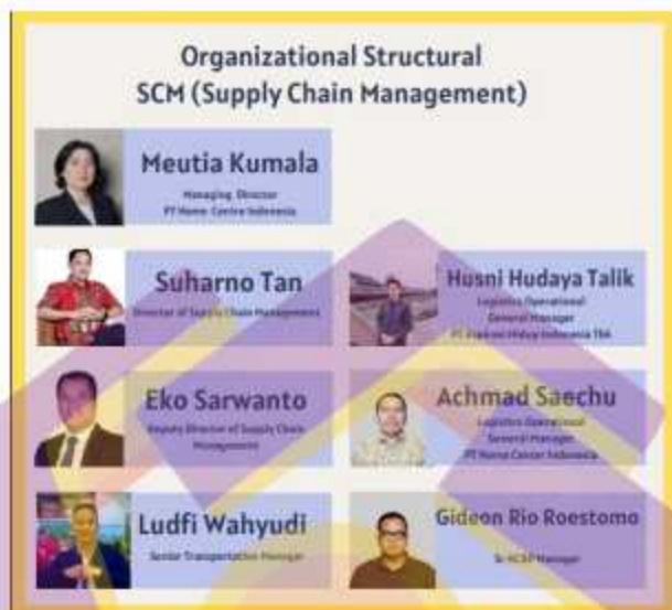
Gambar 1. 1 Struktur Organisasi