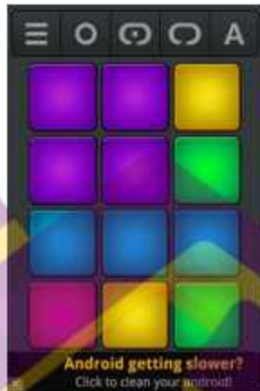
Gambar 1 Contoh Aplikasi Drum Pad 1 Drum Pad Machine – Make Beats