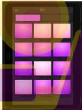
Gambar 2 Contoh Aplikasi Drum Pad 2 Electro Drum Pads 24