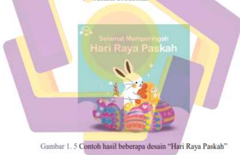
Gambar 1. 5 Contoh hasil beberapa desain “Hari Raya Paskah”

Namun project yang diambil untuk Tugas Akhir non Reguler kali ini adalah sebuah project poster turnamen komunitas game yang bernama IGAMERWORLD COMMUNITY CUP “RISE UP GAMING PC” dan game online yang akan tandingkan kali ini adalah Point Blank Beyond Limits. Yang dilaksanakan pada tanggal 12–13 Maret 2022 secara online diikuti oleh 32 tim di seluruh Indonesia, merebutkan total hadiah uang tunai sebesar Rp. 3.000.000,- dan tambahan mata uang di dalam game tersebut.