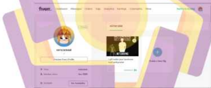
Gambar 1. 1 Tampilan pada penyedia jasa Freelance Fiverr

Dikarenakan penulis mendapatkan klien melalui komunikasi via DM ( Direct Message ) pada aplikasi jejaring sosial bernama Discord , dan akan diarahkan ke WhatsApp agar memudahkan komunikasi dengan klien jika ada kesalahan saat pengerjaan. Namun penulis juga bergabung dengan platform penyedia jasa Freelance yaitu Fiverr dengan username seruzawaai.