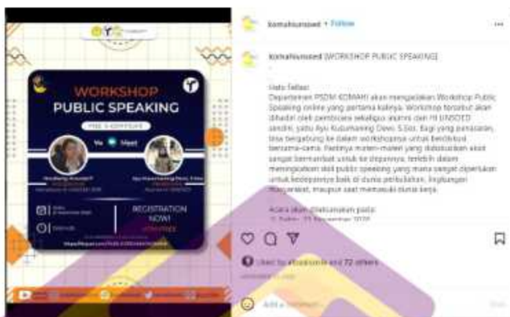
Gambar 1. 4 Contoh hasil beberapa desain “ Workshop Public Speaking Universitas Jendral Soedirman”