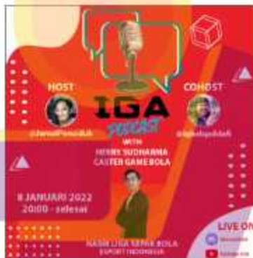
Gambar 1. 3 Contoh hasil beberapa desain “IGA Podcast”

Ada beberapa project yang pernah dikerjakan oleh penulis mulai dari IGA Podcast, Workshop Public Speaking di Universitas Jendral Soedirman, Pembuatan desain kop surat sebuah EO ( Event Organizer ), desain kartu nama, desain eMoney/eToll , Pembuatan desain twibbon , dan beberapa poster ucapan hari raya/hari hari besar nasional lainnya. Contoh dari beberapa project tersebut seperti berikut