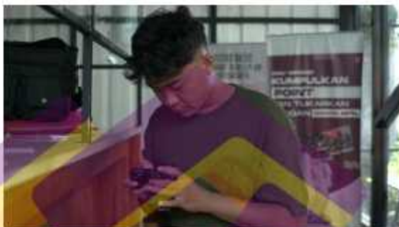
Pengambilan alat di Titik Fokus