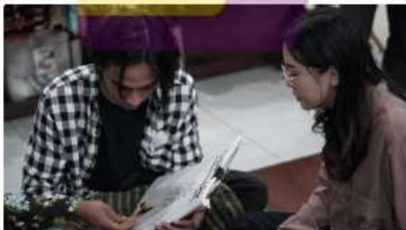
Proses produksi di Malioboro