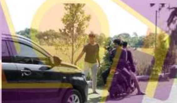
Proses produksi di Khayangan resort