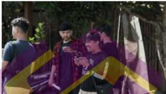
Menerbangkan Drone di area sawah