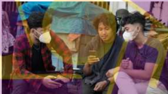
Evaluasi di malioboro