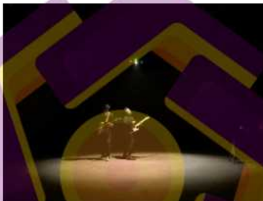
Gambar 6.2 foto bersama

dengan Anggota ketjilbergerak Dan anak anak desa