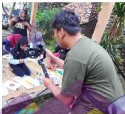
Gambar 6.4 Behind the scene Pegambilan shot Dilapangan