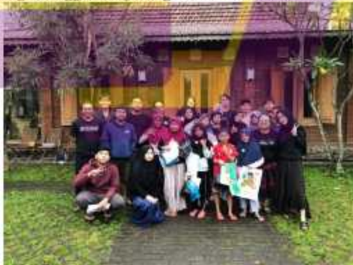
Gambar 6.3 Behind the scene

dengan Anggota ketjilbergerak Dan anak anak desa