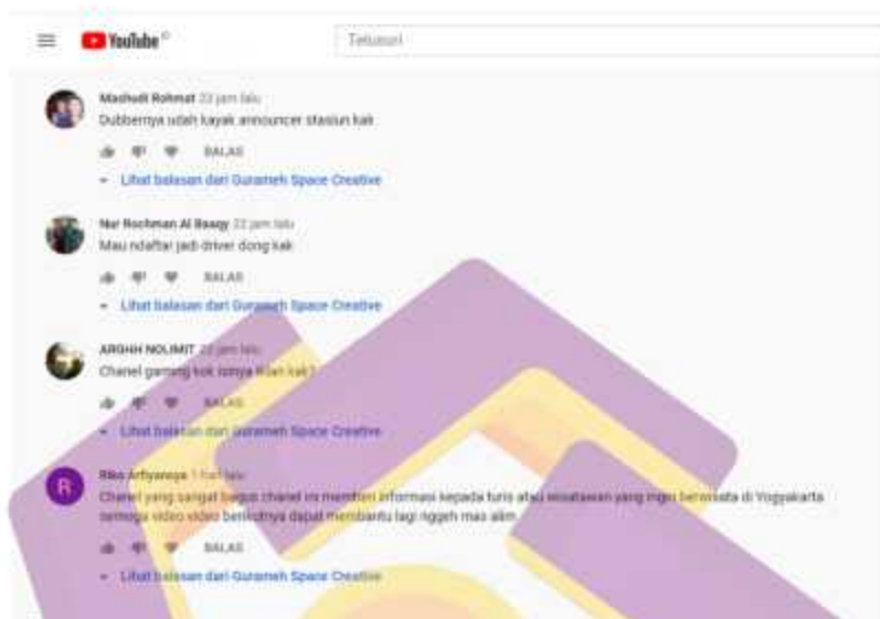
Gambar 5.5 Tanggapan dari masyarakat