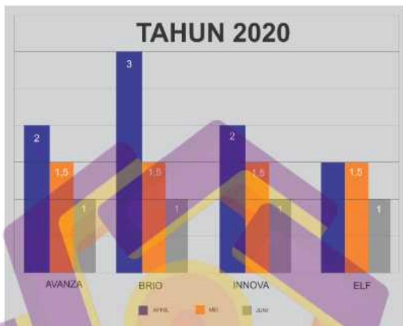
Gambar 5.2 Sesudah video animasi jadi