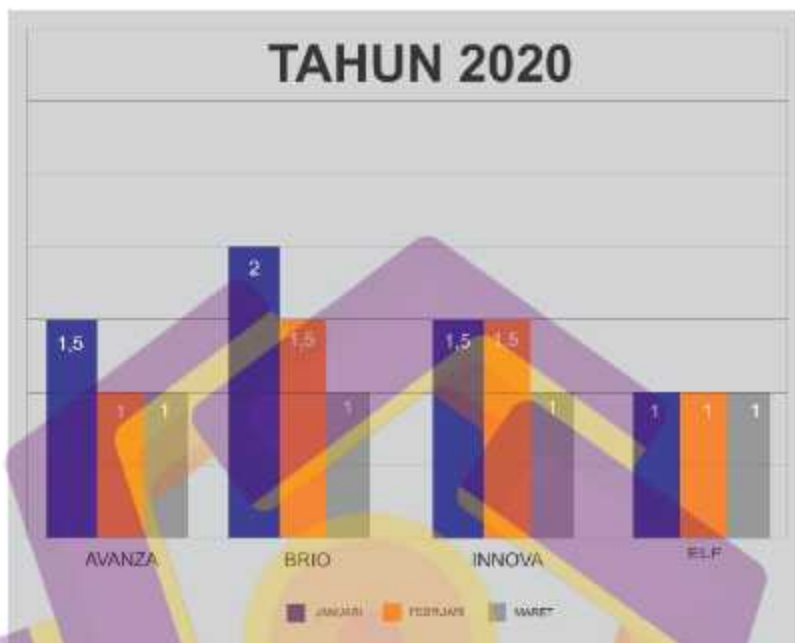
Gambar 5.1 Sebelum video animasi jadi