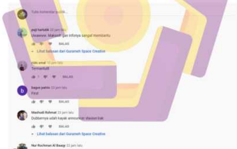
Gambar 5.4 Tanggapan dari masyarakat