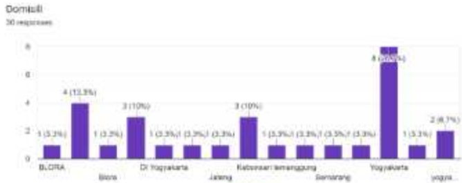
Gambar 1. 1 Domisili Konsumen