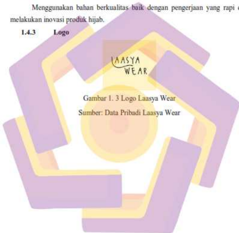
Gambar 1. 3 Logo Laasya Wear