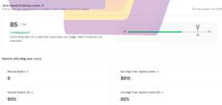
Gambar 1.3.4 Fitur repeat business beserta contoh repeat business score.

Pada situs Fiverr, terdapat salah satu fitur untuk keperluan analisis yang bernama repeat business . Repeat business merupakan sebuah halaman yang menunjukkan seberapa sering para klien atau pembeli melakukan order lebih dari satu kali. Para pembeli yang melakukan hal tersebut biasa disebut dengan sebutan repeat buyer . Semakin sering para freelancer mendapatkan repeat buyer , maka akan meningkatkan repeat business score pada halaman repeat business seperti pada gambar 1.3.4.