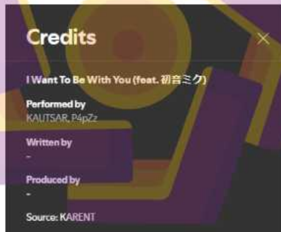
Gambar 1.3.1 Salah satu portofolio penulis yang berjudul Want To Be With You .

Penulis merupakan salah satu artis musik yang telah mendalami bidang produksi musik elektronik semenjak tahun 2017 dengan pengalaman lebih dari 7 tahun. Sampai saat ini, penulis aktif dalam membuat karya-karya musik yang sebagian diantaranya tersedia di berbagai music store seperti Spotify, YouTube Music, dan Apple Music. Beberapa karya yang penulis banggakan diantaranya adalah I Want To Be With You , yang diciptakan bersama dengan salah satu artis musik dari Indonesia, Kautsar Music serta Leave With Me Remix , kolaborasi dengan Babaz dan SPHERICZ yang dapat dilihat pada gambar 1.3.1 dan 1.3.2.