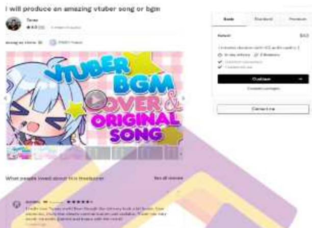
Gambar 1.3.3 salah satu gigs penulis yang berjudul produce an amazing vtuber song or bgm.

Pada situs Fiverr, terdapat salah satu fitur untuk keperluan analisis yang bernama repeat business . Repeat business merupakan sebuah halaman yang menunjukkan seberapa sering para klien atau pembeli melakukan order lebih dari satu kali. Para pembeli yang melakukan hal tersebut biasa disebut dengan sebutan repeat buyer . Semakin sering para freelancer mendapatkan repeat buyer , maka akan meningkatkan repeat business score pada halaman repeat business seperti pada gambar 1.3.4.