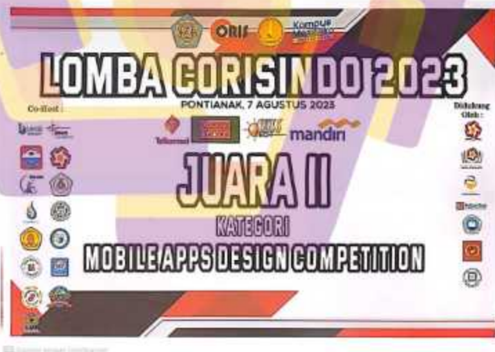
Gambar 4. 6 Piagam Lomba Juara 2 Mobile Design