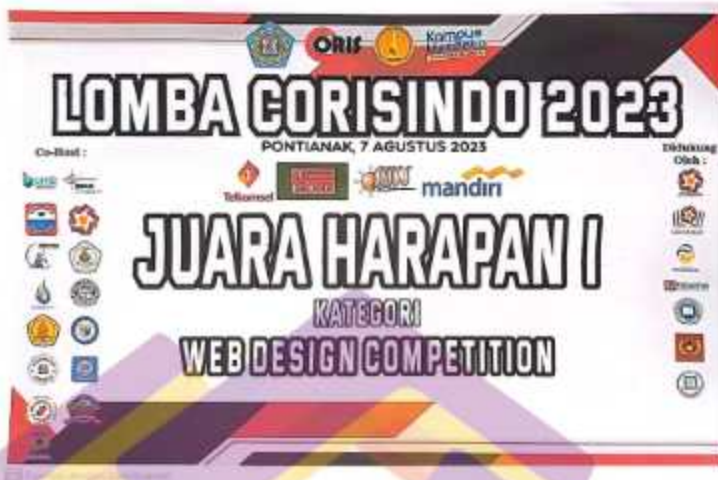
Gambar 4. 7 Piagam Lomba Harapan I Web Design