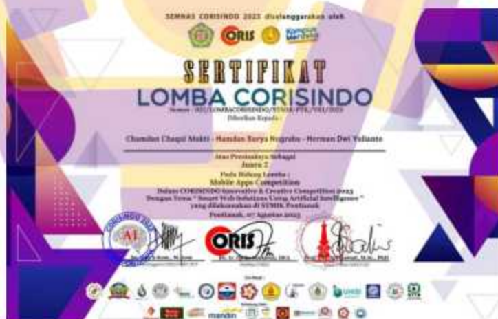
Gambar 4. 3 Sertifikat Juara 2 Mobile