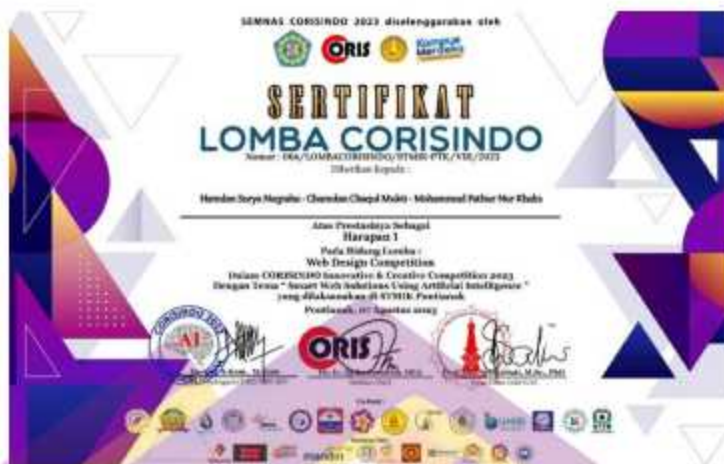
Gambar 4. 4 Sertifikat Harapan 1 Web