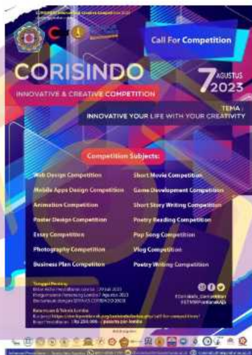
Gambar 4. 1 Poster Corisindo

CORISINDO 2023 membuktikan bahwa kreativitas dan inovasi dapat menjadi kekuatan utama yang membawa perubahan positif dalam kehidupan kita. Dalam suasana persaingan yang ketat, lomba ini menjadi tonggak bersejarah dalam mempromosikan ide dan gagasan yang dapat menjadi edukasi bagi masyarakat secara luas.