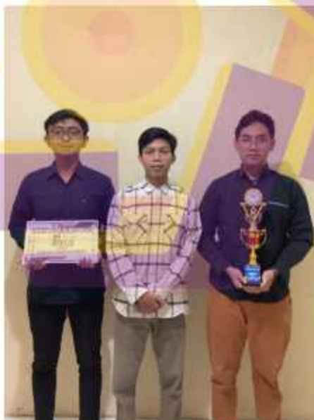
Gambar 4. 8 Bukti Hasil Lomba