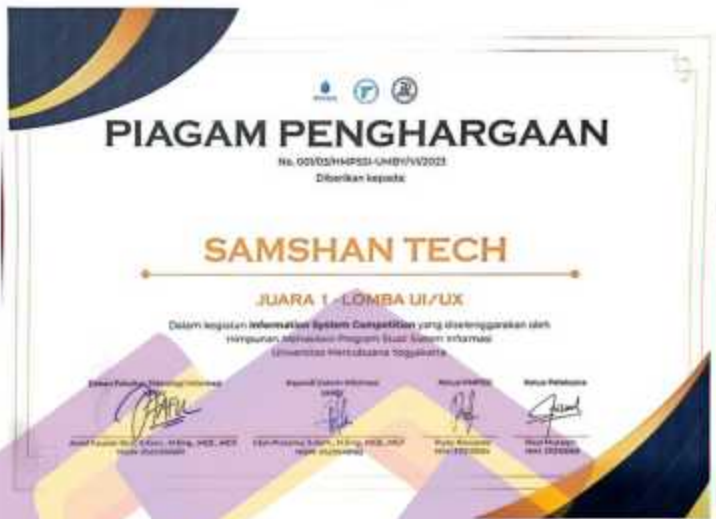
Gambar 4. 5 Sertifikat Juara 1 UI UX Competition