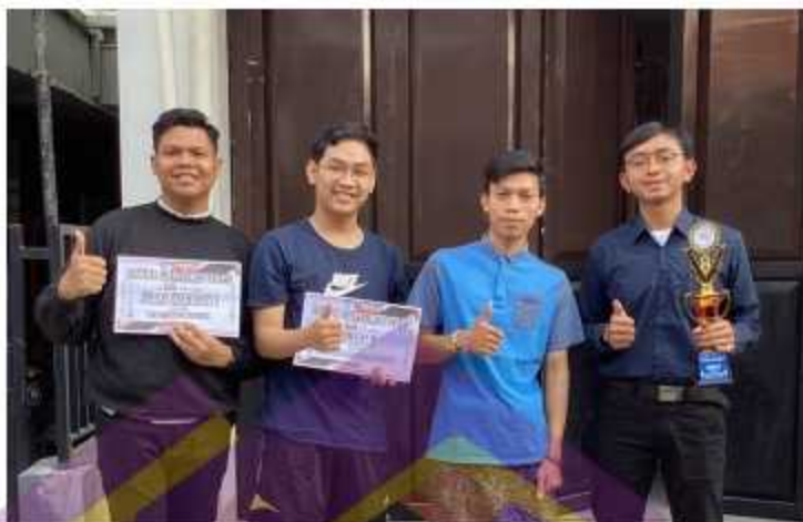
Gambar 4. 9 Bukti Hasil Lomba