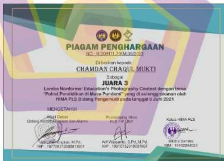
Gambar 4. 6 Sertifikat Juara 3 Lomba Fotografi