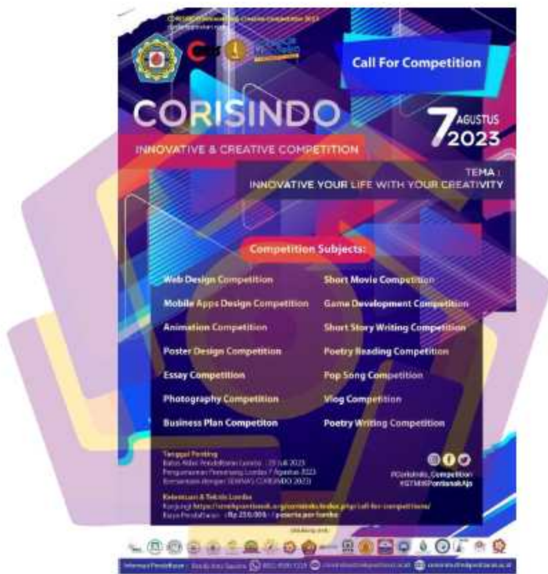
Gambar 4. 1 Poster Lomba Corisindo

CORISINDO 2023 membuktikan bahwa kreativitas dan inovasi dapat menjadi kekuatan utama yang membawa perubahan positif dalam kehidupan kita. Dalam suasana persaingan yang ketat, lomba ini menjadi tonggak bersejarah dalam mempromosikan ide dan gagasan yang dapat menjadi edukasi bagi masyarakat secara luas.