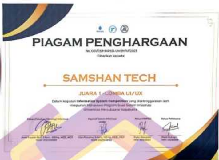
Gambar 4. 5 Sertifikat Juara 1 Lomba UI UX