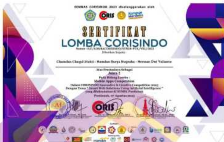
Gambar 4. 3 Sertifikat Juara 2 Mobile Apps Competition