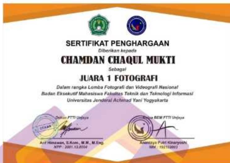
Gambar 4. 11 Sertifikat Juara 1 Lomba Fotografi