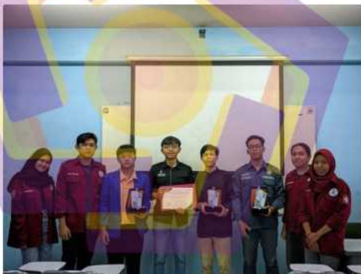
Gambar 4. 16 Piagam Kejuaraan UI UX Competiton