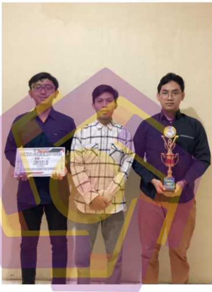
Gambar 4. 14 Piagam Kejuaraan Mobile Apps Competititon