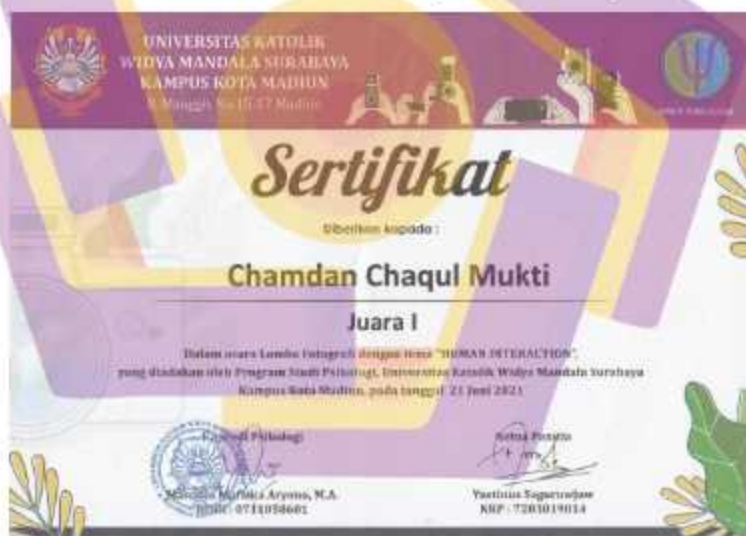
Gambar 4. 10 Sertifikat Juara 1 Lomba Fotografi