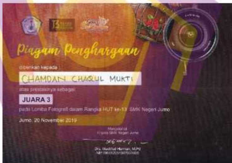
Gambar 4. 12 Sertifikat Juara 3 Lomba Fotografi