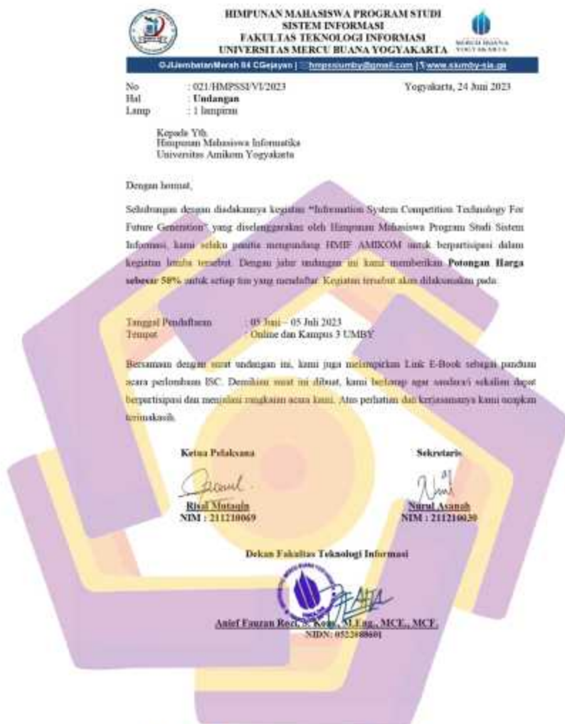
Gambar 4. 18 Surat Rekomendasi Lomba UI UX Competition