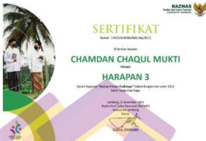
Gambar 4. 9 Sertifikat Juara Harapan 3 Lomba Fotografi