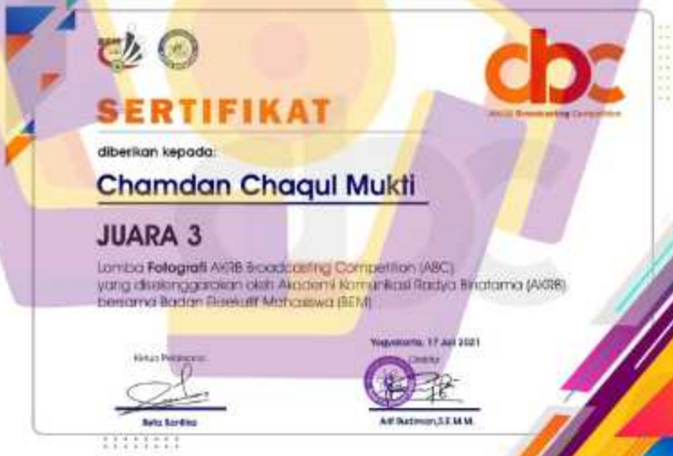
Gambar 4. 8 Sertifikat Juara 3 Lomba Fotografi