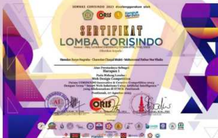
Gambar 4. 4 Sertifikat Juara Harapan 1 Web Design Competition