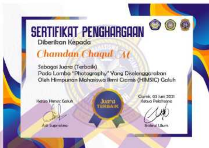
Gambar 4. 13 Sertifikat Juara Terbaik Lomba Fotografi