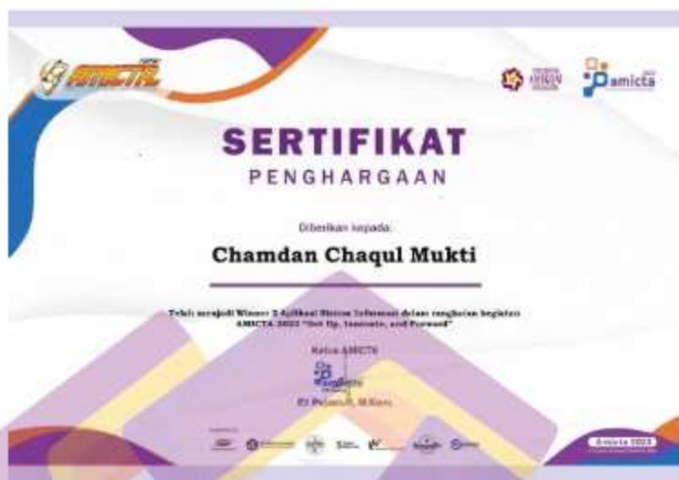
Gambar 4. 7 Sertifikat Juara 2 Aplikasi Sistem Informasi AMICTA