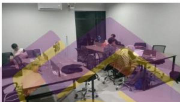
Gambar 1.1 Tampak Dalam Kantor Dunia Coding

Kantor utama dari Dunia Coding sendiri beralamat di Sleman, tepatnya di Jl. Damai No.R7, Wonorejo, Sariharjo, Kec. Ngaglik, Kabupaten Sleman, Daerah Istimewa Yogyakarta. Seperti pada Gambar 1.1, kantor ini digunakan oleh seluruh karyawan PT. Media Talenta Teknologi terkhusus Dunia Coding untuk berdiskusi, melakukan rapat, pembuatan konten, dan lainnya.