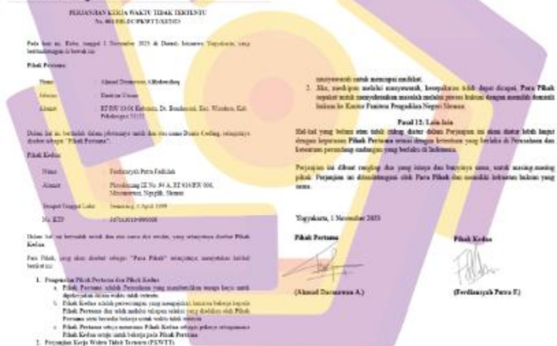
Gambar 1.3 Surat Pengangkatan Kontrak Kerja