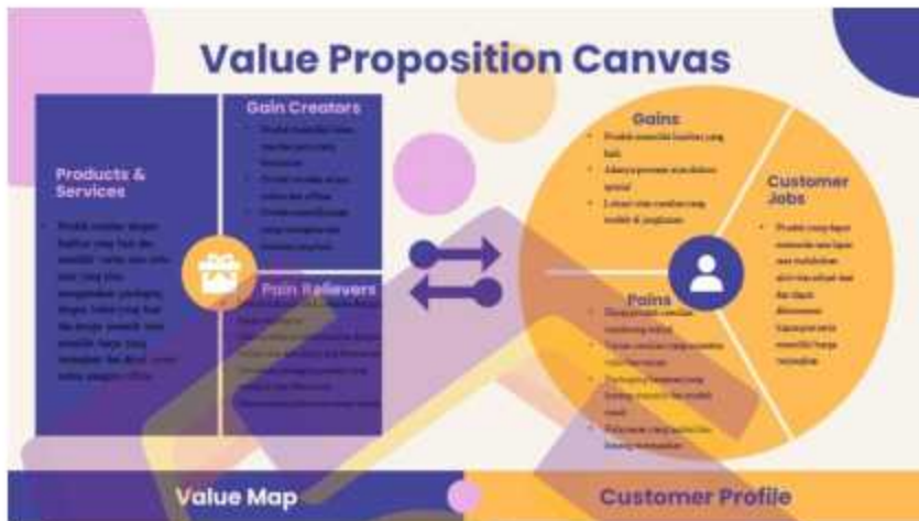
Gambar 1.1 Value proposition canvas