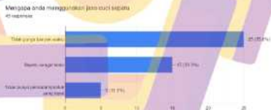
Gambar 1.2 Grafik Hasil Responden Berdasarkan Waktu

Dari hasil data kuisioner di atas permasalahan yang ada pada konsumen Cidshoescare adalah dari konsumen tidak memiliki banyak waktu untuk mencuci sepatunya sendiri.