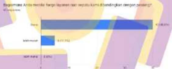
Gambar 1.4 Grafik Hasil Responden Berdasarkan Harga

Dari hasil data kuisisioner di atas permasalahan yang ada pada konsumen Cidshoescare adalah dari konsumen menilai harga yang diberikan oleh Cidshoescare sama dengan para pesaing dan ada beberapa konsumen yang meninal harga yang diberikan oleh Cidshoescare lebih murah dibanding pesaing.