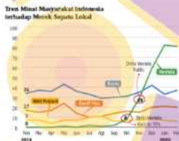
Gambar 1.1 Data Merek Sepatu Lokal

keempat produsen alas kaki terbesar di dunia di bawah Tiongkok, India, dan Vietnam. dengan produksi 1,41 miliar pasang sepatu pada tahun 2018 dan Indonesia berkontribusi sekitar 4,6% ( 46.000.001.886 ) pasang sepatu di seluruh dunia. Dengan jumlah peningkatan angka tersebut menjadikan peralihan fungsi sepatu yang awalnya pada saat ini sepatu yang awalnya hanya dianggap sebagai kebutuhan primer berubah menjadi gaya hidup atau life style . Trend sneakers secara global di seluruh dunia berbeda satu sama lain. Di luar negeri trend sneakers dimulai dari olahraga basket, sedangkan di Indonesia trend sneakers muncul dari musik. CNN Indonesia Syed Muhammad co-founder dan CEO USS network 2018 mengatakan bahwa di Indonesia tren sneakers masuk melalui musik yang berkembang seperti, musik hip hop dan r&b di tahun 2015 – 2016.