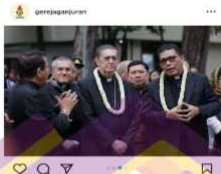
Gambar 1. 8 Kunjungan Kardinal Miguel Angel Ayuso