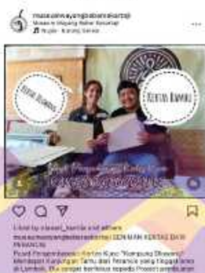
Gambar 1. 11 Kunjungan Wisatawan Mancanegara di Museum Wayang Beber Sekartaji