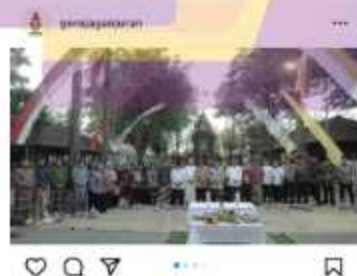
Gambar 1. 9 Kenduri Lintas Iman

Pada gambar 1.8 diatas, Kardinal Ayuso dan rombongan mengunjungi RS St. Elisabeth Ganjuran, panti asuhan, susteran CB, dan area gereja, didampingi oleh Manajer Rubi, Rm Wondo, dan Rm Maradiyo. Selama perjalanan, Rm Sugihartanto menjelaskan sejarah berdirinya gereja dan candi kepada rombongan. Setiap tahun, Gereja Ganjuran mengadakan kenduri lintas iman yang diikuti oleh orang dari semua agama dan kepercayaan. Kenduri Lintas Iman ini merupakan acara kenduri satu-satunya yang ada di Kabupaten Bantul (Sumber: Instagram @gerejaganjuran, 2024 diakses pada 12 maret 2024).