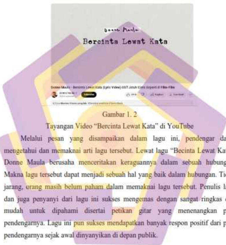
Gambar 1. 2

memiliki makna yang mendalam didalamnya. Dalam lagu ini, menjelaskan mengenai sebuah keraguan yang begitu dalam yang dimiliki oleh seseorang terhadap pasangannya dalam sebuah hubungan.