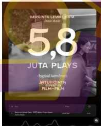
Gambar 1. 1

Lagu dengan judul “Bercinta Lewat Kata” ditulis dan dinyanyikan oleh Donne Maula yang merupakan penyanyi sekaligus suami dari penyanyi Yura Yunita. Donne Maula menciptakan lagu ini dalam waktu satu jam bertepatan dengan konser bertajuk Tutar Batin pada tanggal 16 Juni 2023. Pada konser tersebut juga lagu ini pertama kali dinyanyikan oleh Donne dan Yura yang menyebabkan ramainya sosial media karena lagu tersebut. Pada akhirnya, Donne Maula merilis lagu tersebut pada tanggal 26 Juli 2023. Lagu ini sempat menduduki peringkat ke 7 tangga lagu Spotify Indonesia pada 6 November 2023 dan mendapatkan lebih dari 5,8 juta putar.