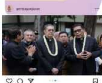
Gambar 1. 4 Kunjungan Kardinal Miguel Angel Ayuso