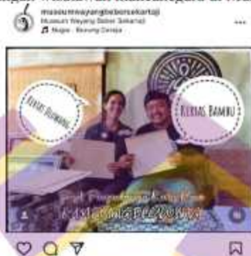
Gambar 1. 6 Kunjungan wisatawan mancanegara di Museum Wayang Beber