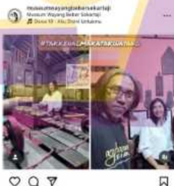
Gambar 1. 7 Kunjungan Wisatawan Lokal di Museum Wayang Beber Sekartaji