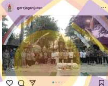
Gambar 1. 5 Kenduri Lintas Iman