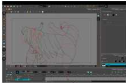
Gambar 3. 41 Implementasi smear pada frame 35