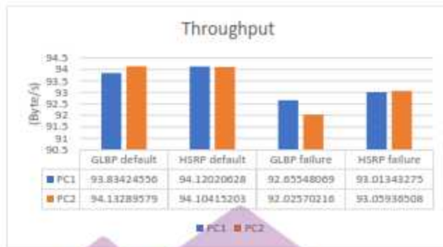
Gambar 11. Grafik Parameter Throughput