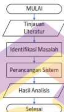
Gambar 1. Tahapan Penelitian