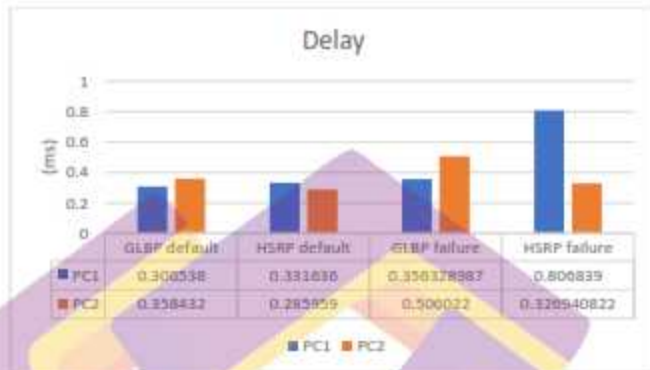
Gambar 13. Grafik Parameter Delay

ms. Adapun dalam keadaan hardware failure GLBP memiliki waktu delay yang lebih kecil dibandingkan HSRP. GLBP memiliki rata-rata delay sebesar 0,431 ms sedangkan HSRP memiliki rata-rata delay sebesar 0,566. Hasil dari pengujian parameter throughput dapat dilihat pada Gambar 13.