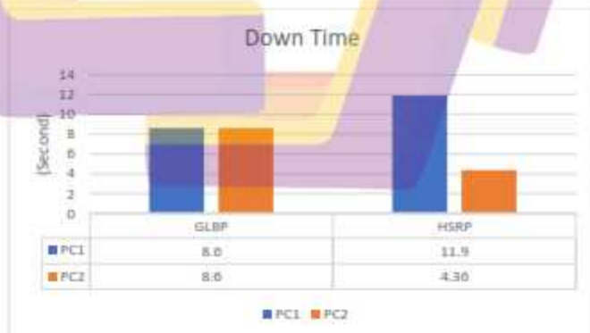
Gambar 14. Grafik Parameter Downtime

Hasil dari pengujian ini menunjukkan bahwa downtime yang dibutuhkan oleh protocol HSRP lebih cepat dibandingkan dengan protocol GLBP. HSRP membutuhkan downtime selama 8,13 second sedangkan untuk GLBP membutuhkan downtime selama 8,6 second. Adapun selisih downtime dari HSRP dan GLBP adalah 0,47 second. Hasil dari pengujian parameter throughput dapat dilihat pada Gambar 14.