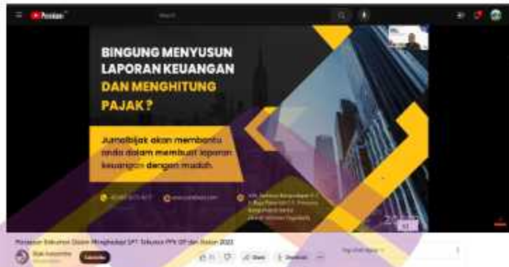
Gambar 1.1 Acara Webinar Launching Jurnalbijak

Indonesia yang memiliki banyak UMKM (Usaha Mikro Kecil dan Menengah) diputuskan untuk launching ke publik pada tanggal 6 Januari 2023.