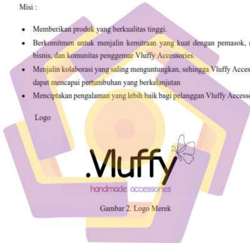
Gambar 2. Logo Merek