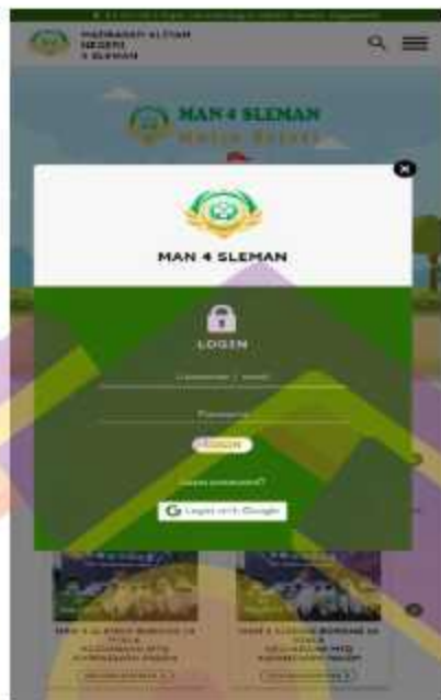
Gambar 5. 5 Desain ulang navigasi login website MAN 4 Sleman