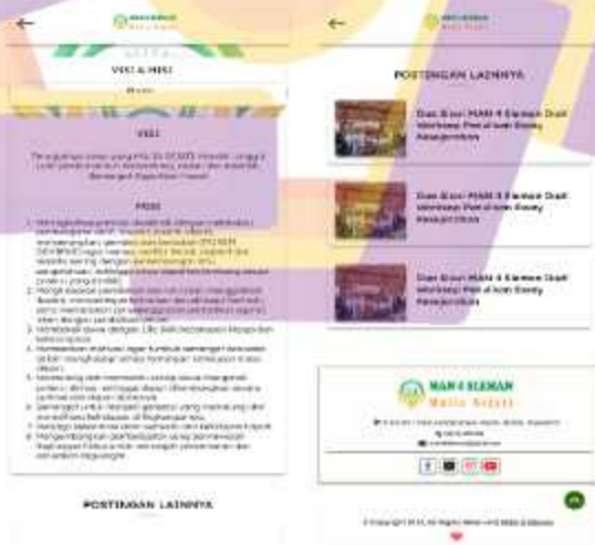
Gambar 5. 6 Desain ulang menu visi & misi website MAN 4 Sleman