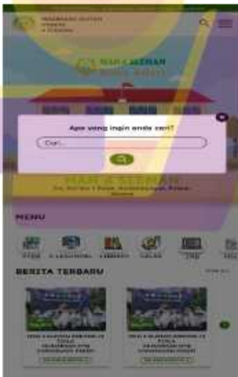
Gambar 5. 4 Desain ulang navigasi search website MAN 4 Sleman