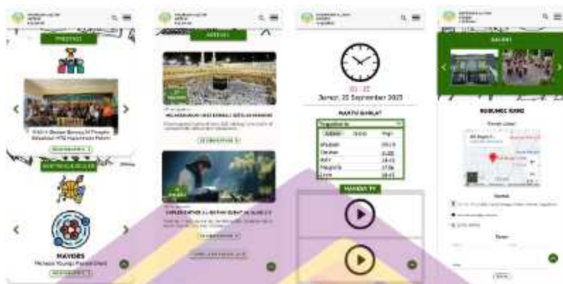
Gambar 5. 9 Desain ulang homepage lanjutan website MAN 4 Sleman