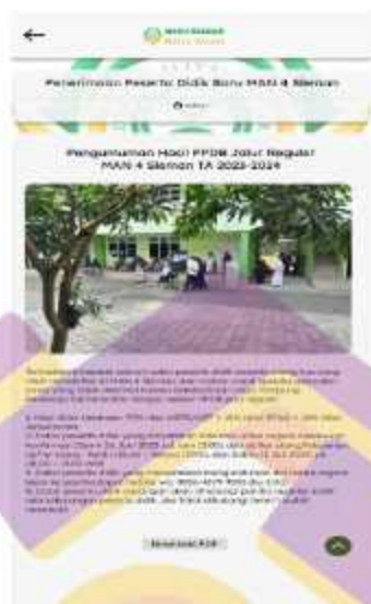
Gambar 5. 7 Desain ulang menu PPDB website MAN 4 Sleman