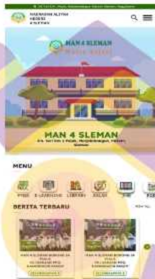
Gambar 5. 1 Desain ulang homepage website MAN 4 Sleman

Berikut saran lain dari peneliti berupa rekomendasi beberapa perbaikan ulang pada tampilan website MAN 4 Sleman berdasarkan saran dari responden yaitu penyesuaian warna, ukuran teks dan ukuran gambar :