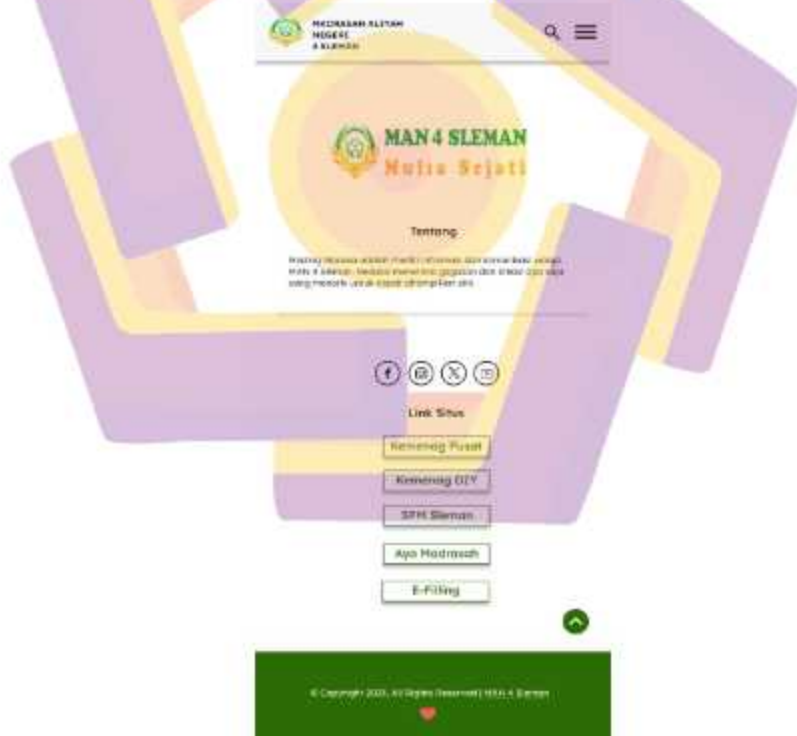
Gambar 5. 10 Desain ulang homepage akhir website MAN 4 Sleman