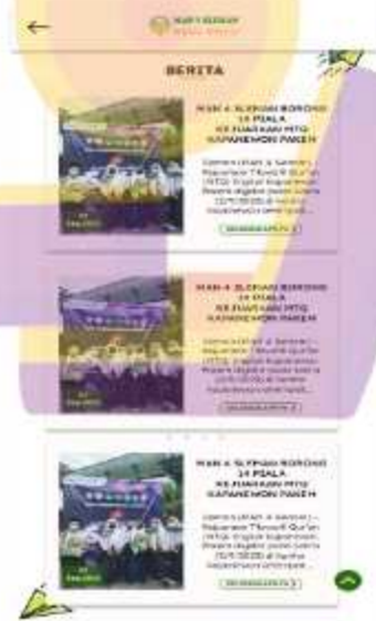
Gambar 5. 8 Desain ulang menu berita website MAN 4 Sleman