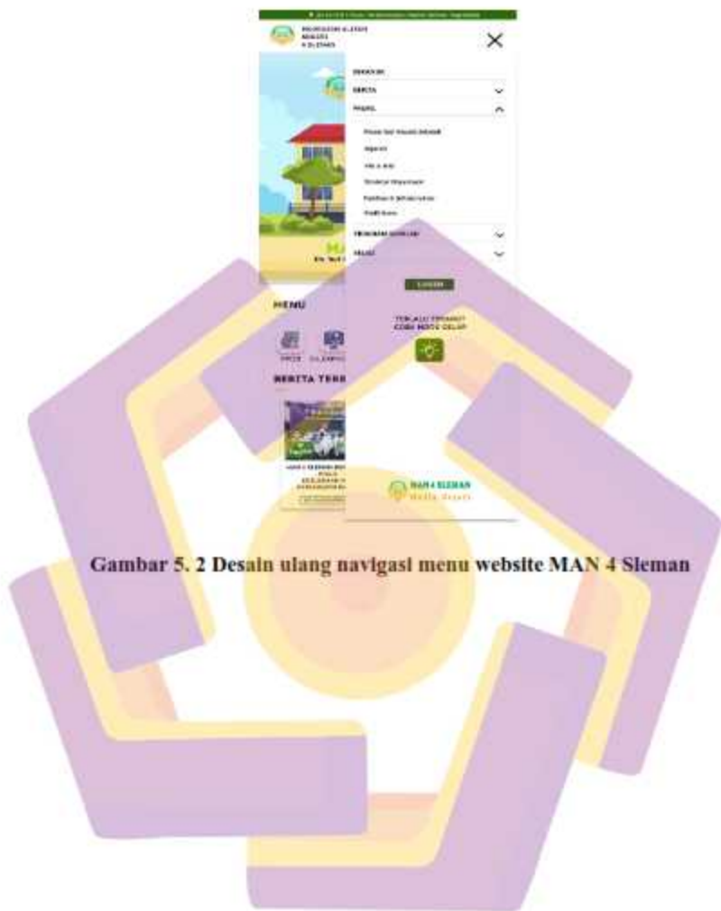
Gambar 5. 2 Desain ulang navigasi menu website MAN 4 Sleman