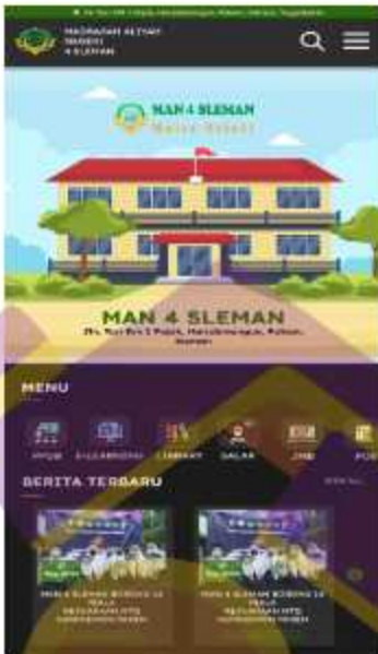
Gambar 5. 3 Desain ulang homepage mode gelap website MAN 4 Sleman