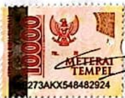
Eka Nur Pratiwi