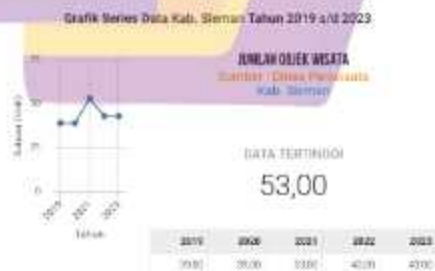
Gambar 1. 3 Data desa wisata di Kabupaten Sleman