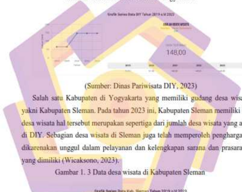
Gambar 1. 2 Data desa wisata di Yogyakarta

Daerah Istimewa Yogyakarta memiliki satuan pariwisata dengan nama desa wisata. Desa wisata merupakan suatu konsep dari pengembangan wilayah yang menjadikan desa sebagai destinasi wisata. Berdasarkan data dari Badan Perencanaan dan Pembangunan Daerah (Bappeda) DIY memiliki jumlah desa wisata sebanyak 148 desa pada tahun 2023.