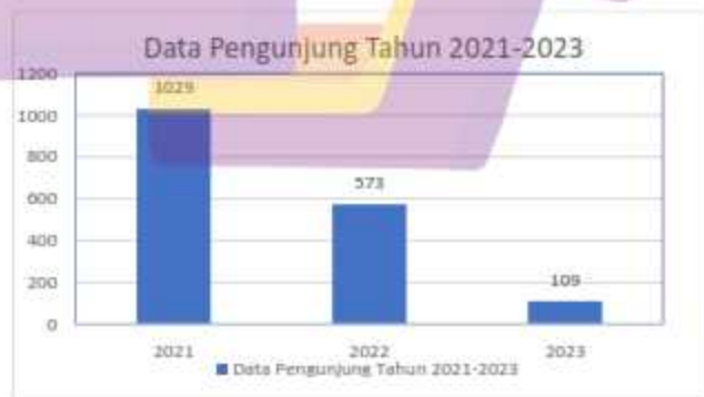
Tabel 1. 1 Jumlah pengunjung 2021-2023

(Sumber: Arsip dari Desa Wisata Merapi Turgo, 2023)