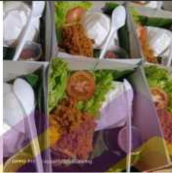
Nasi Box Ayam Goreng Kalasan