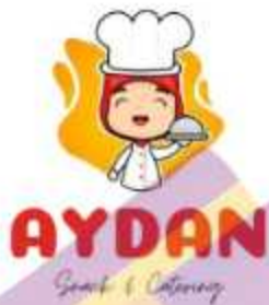
Gambar 2. 3 Logo

Visi : Menjadi bisnis catering yang mengutamakan permintaan, keinginan, dan harapan pelanggan terhadap kepuasan rasa sehingga dapat dipercaya.