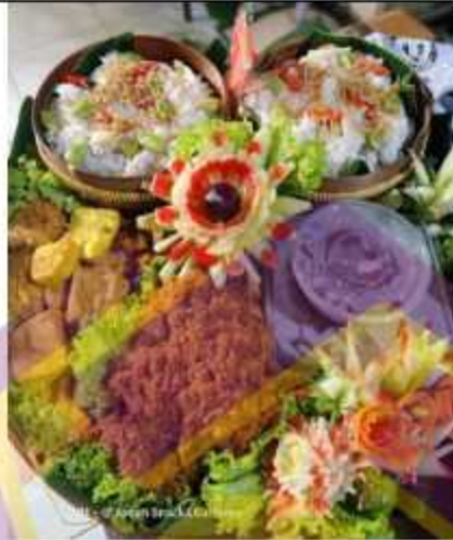
Tumpeng Tampah Nasi Liwet