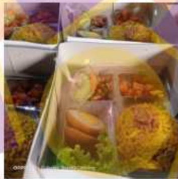
Nasi Box Kebuli