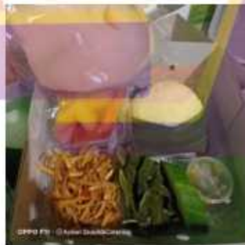
Nasi Box Paket Ekonomi