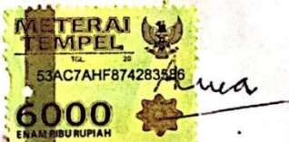
Auva Bima'ahada A