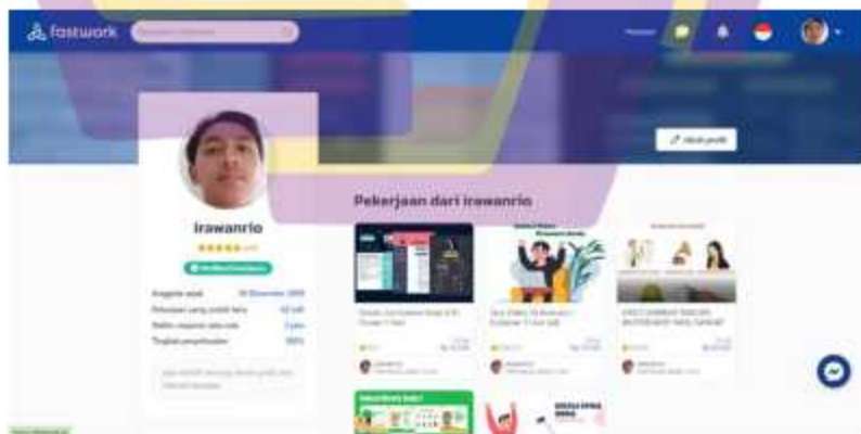
Gambar 1. 3 Profil fastwork

Gambar 1.3 menampilkan profil pengguna dari situs Fastwork yang mencakup informasi tentang jumlah pekerjaan yang telah diselesaikan dan total ulasan yang diterima selama bekerja di platform ini.