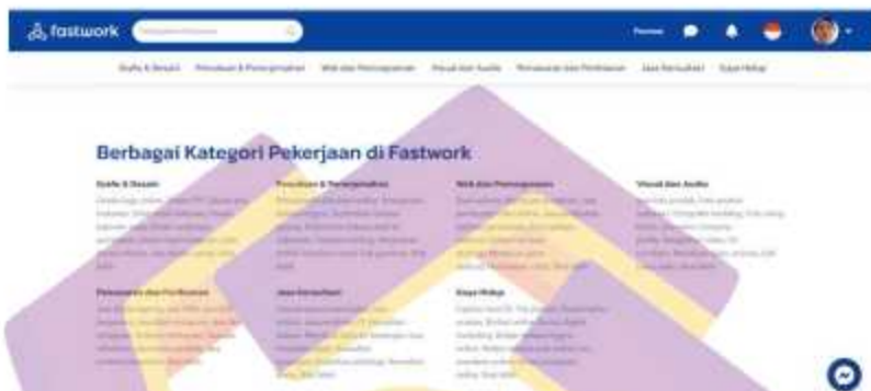
Gambar 1. 2 Kategori jasa freelance lain di fastwork

g. Gaya Hidup: Jasa fotografi, konseling, perjalanan, dan gaya hidup lainnya