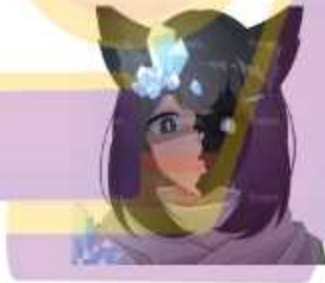
Gambar 1.1 Contoh hasil ilustrasi 1

Penulis sudah berkarier pada website Fiverr sejak 2019 dan sudah mengerjakan lebih dari 1400 pesanan. Ilustrasi yang dikerjakan mulai untuk kebutuhan assets content creator, merchandise, dan profil foto . Contoh hasil ilustrasi yang dikerjakan penulis dan hasil review dapat dilihat pada gambar 1.1 sampai gambar 1.6 dibawah.