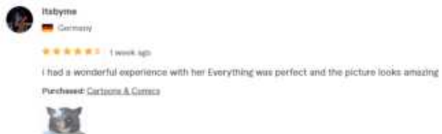
Gambar 1.2 Rating & Review dari Ilustrasi 1