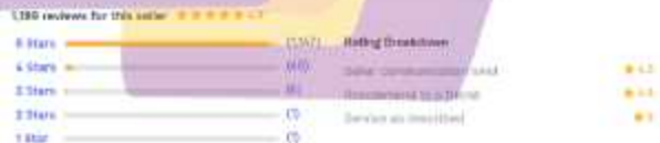
Gambar 1.7 Jumlah Rating & Review

Sejak 2019 memulai jasa ilustrasi pada website Fiverr penulis sudah mendapatkan 1199 review & rating . Screenshot jumlah rating yang diperoleh penulis dapat dilihat pada gambar 1.7 dibawah.