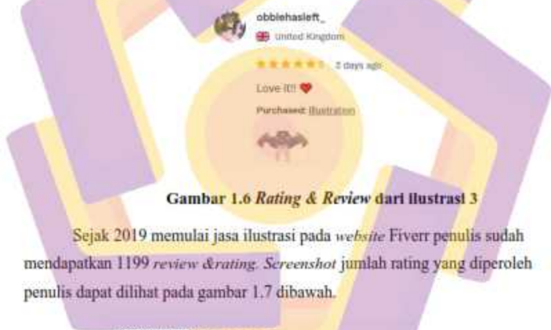
Gambar 1.6 Rating & Review dari ilustrasi 3

Sejak 2019 memulai jasa ilustrasi pada website Fiverr penulis sudah mendapatkan 1199 review & rating . Screenshot jumlah rating yang diperoleh penulis dapat dilihat pada gambar 1.7 dibawah.