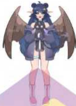
Gambar 1.5 Contoh hasil ilustrasi 3