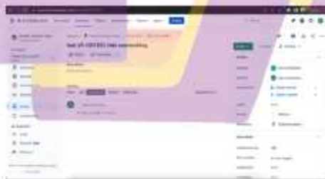
Gambar 2.1. Backlog Jira untuk menambahkan metode pembayaran dengan virtual account host to host Bank Syariah Indonesia (BSI) dan menghilangkan metode pembayaran overbooking pada aplikasi Perfect Solution Syariah.