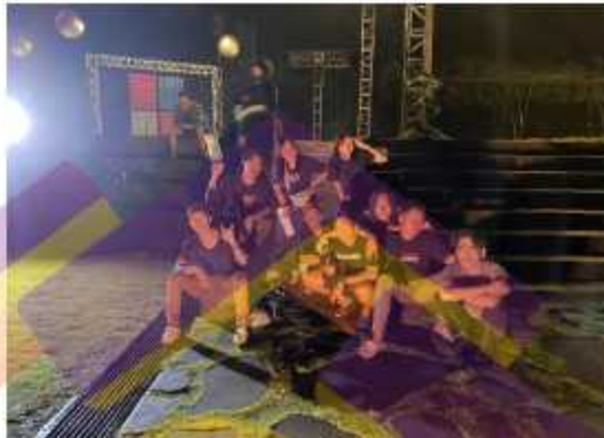
Gambar 6 Jeda proses produksi