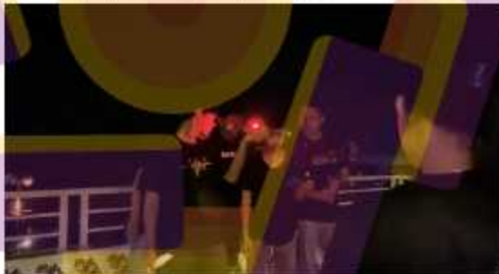
Gambar 5 Proses pengambilan footage menggunakan video drone