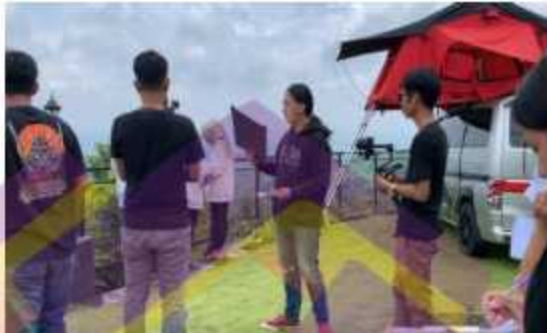
Gambar 4 Proses produksi pembuatan video promosi