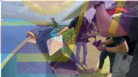
Gambar 7 Proses produksi pembuatan video promosi