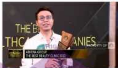
Gambar 3 Penghargaan skincare Athena

ATHENS GROUP SABET THE BEST BEAUTY CLINIC 2022