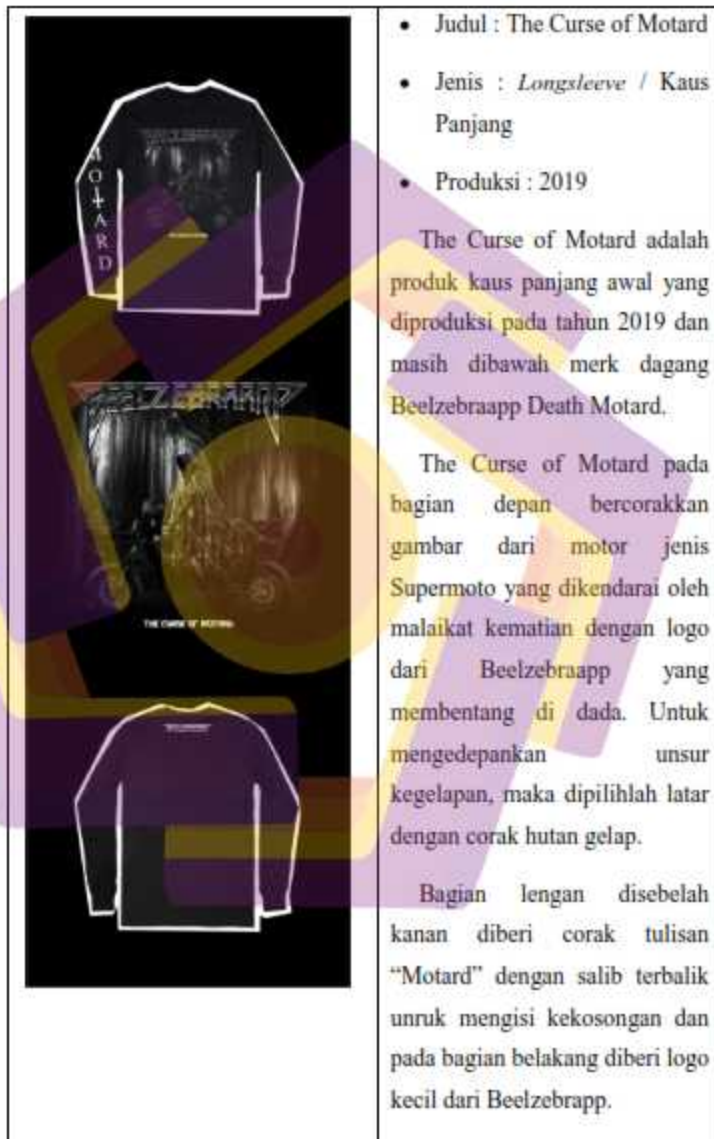
Tabel 1.3. 1 The Curse of Mortad