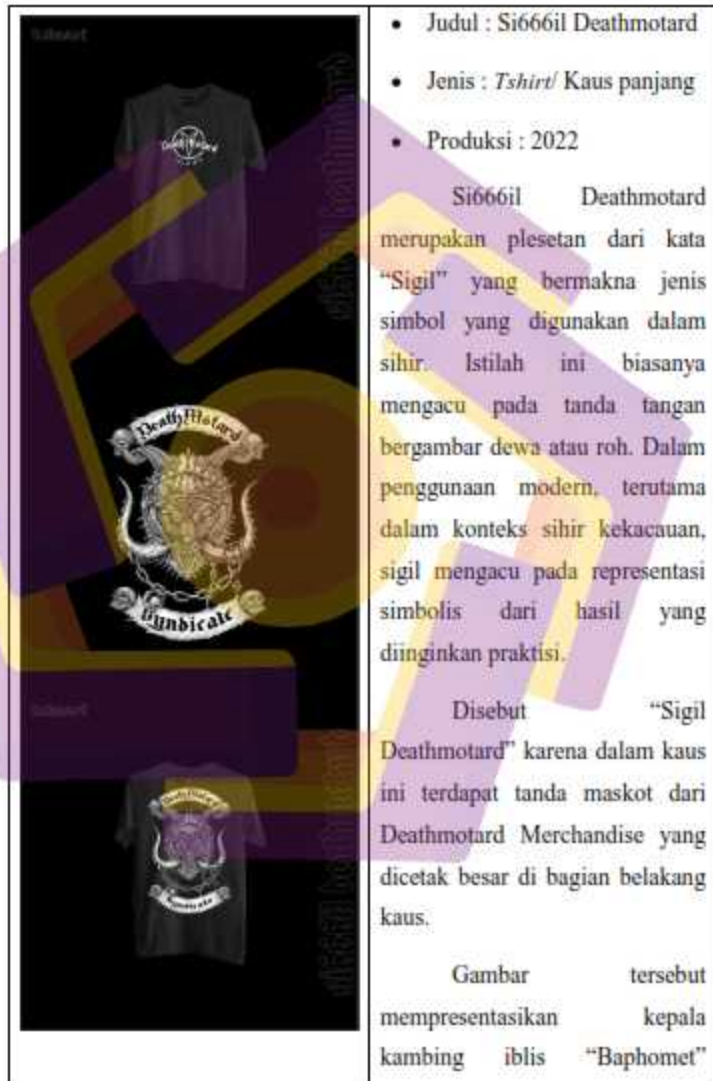
Tabel 1.3. 2 Si666il Deatmortard