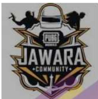
PUBG (Jawara Community)