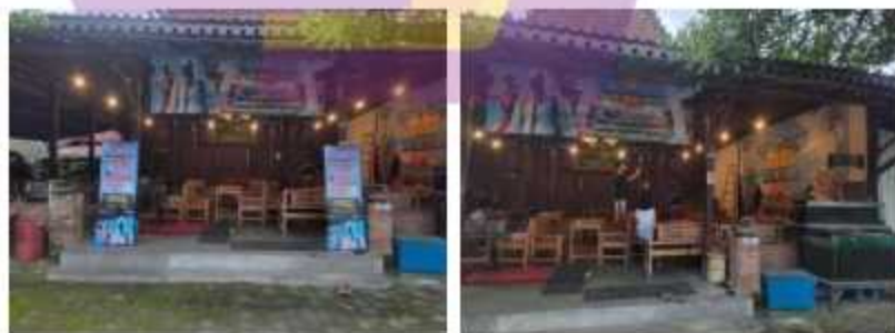
Dokumentasi Event PUBG Mobile Campus Championship (PMCC)