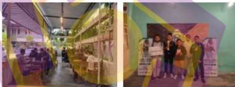
Dokumentasi Event Jawara Local Qualifier