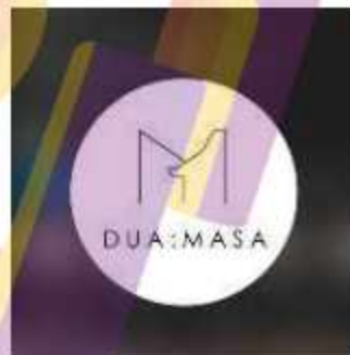
Dua Masa Coffee