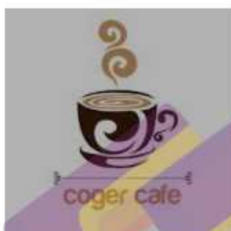
Cogor Cafe Maguwoharjo