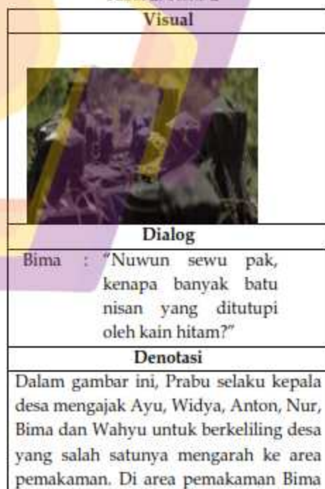
Tabel 2: Scene 2