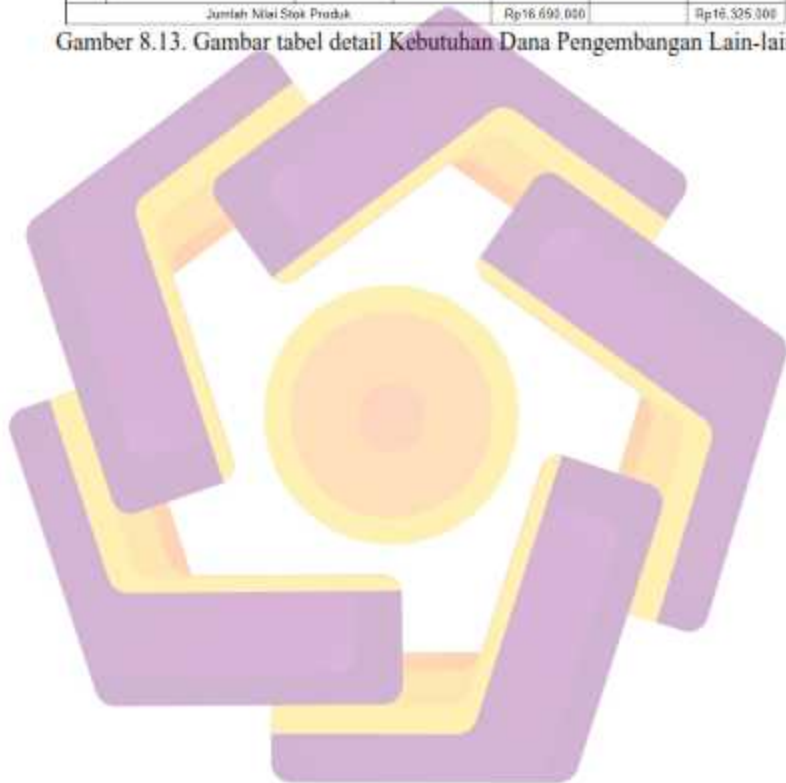
Gambar 8.13. Gambar tabel detail Kebutuhan Dana Pengembangan Lain-lain