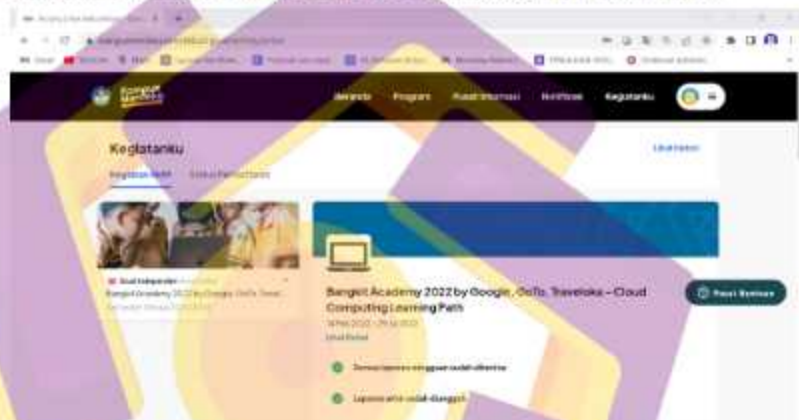
Lampiran 1. 2 bukti menyerahkan produk ke lokasi magang / studi independent