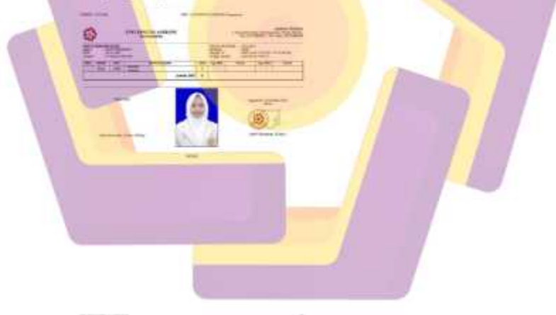
Lampiran 1. 4 gambar Krs yang berjalan