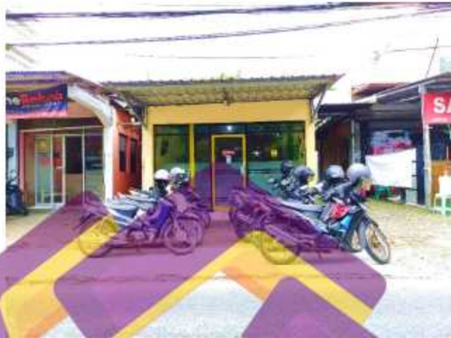
Gambar 1.2. Kantor tampak depan