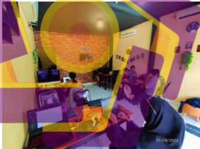
Gambar 1.3. Ruang kerja karyawan