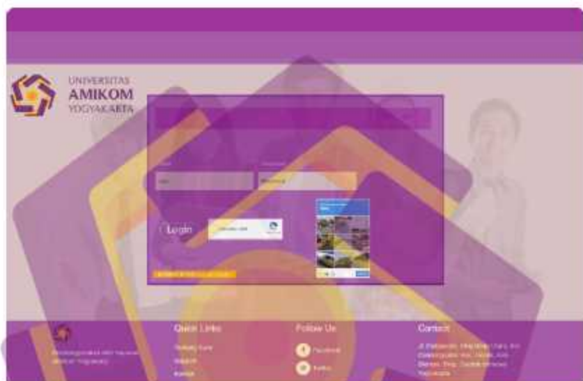
Gambar 25 Rekomendasi Tampilan visual halaman login

tampilan mockup yang sudah dibuat seperti pada Gambar 4.24. Memberi tahu tentang visual yang dibutuhkan agar pengguna tertarik membuka website, dan memberi tahu notifikasi saat login dengan konfirmasi captcha box bahwa user ingin mengakses website dengan keinginan pengguna.