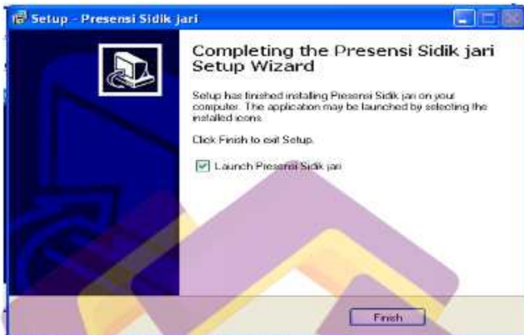
Gambar 5.52 Proses Instalasi Terakhir Aplikasi