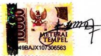
Rina Puji Utami