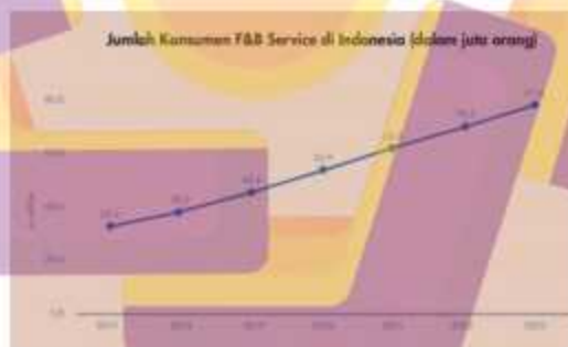
Gambar 1.1 Statistik jumlah konsumen F&B di Indonesia

Perkembangan bisnis saat ini menjadi sangat pesat, setiap pelaku usaha pada tiap kategori atau bidang bisnis dituntut untuk memiliki kepekaan terhadap perkembangan bisnis yang ada untuk menghadapi perubahan yang terjadi untuk tetap memprioritaskan kepuasan pelanggan sebagai tujuan utama (Kotler, 2005). Salah satu bisnis yang saat ini sedang menjamur merupakan bisnis Coffee shop atau kedai kopi. Di Indonesia sendiri bisnis tersebut bertumbuh di segala tempat mulai daerah pelosok hingga perkotaan, dan di prediksi terus meningkat dengan pendapatan total sektor usaha bisnis kopi mencapai 4,16 miliar setiap tahunnya (Idris Rusadi Putra, 2018).