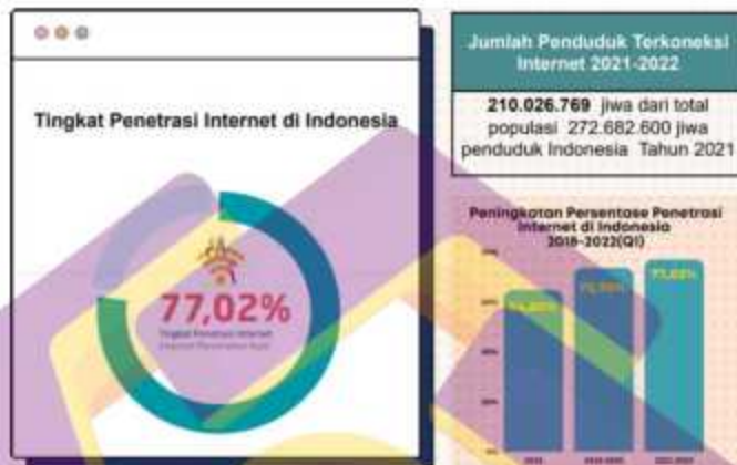
Gambar 1.3 Diagram Jumlah pengguna internet di Indonesia