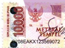
Mohammad Faisal Akbar